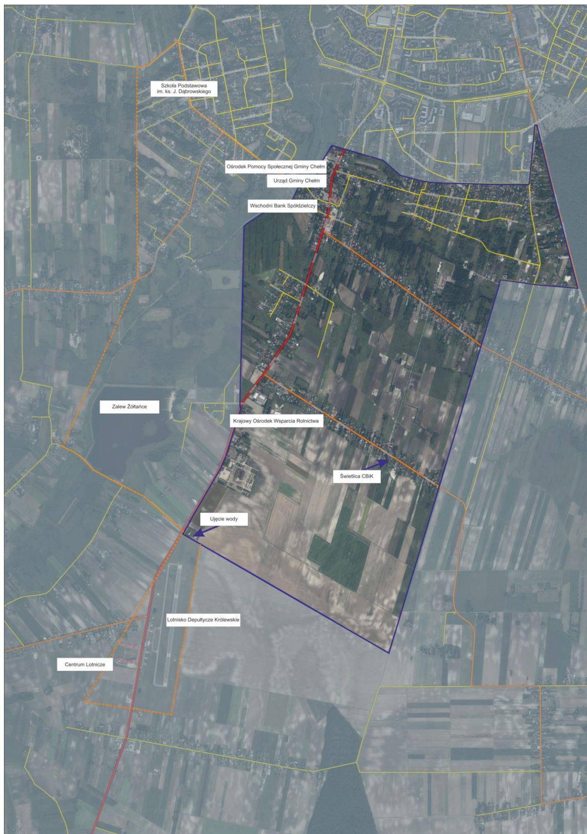
Ryc. 2. Mapa pogładowa

(opracowanie własne na podstawie: geoportal.gov.pl)